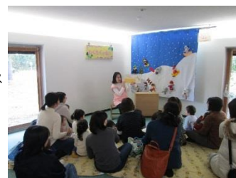
【写真】「おはなしのへや」で開催しているイベント