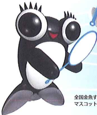
全国金魚すくい選手権大会 マスコットキャラクター きんとと