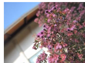
【写真】「香りの丘」のエリカ

〈主 催〉 加古川ウェルネスパーク 「加古川ウェルネスパーク指定管理者：STRKS（ストークス）グループ」